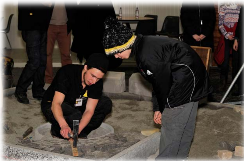
Un apprenti explique les gestes au jeune intéressé