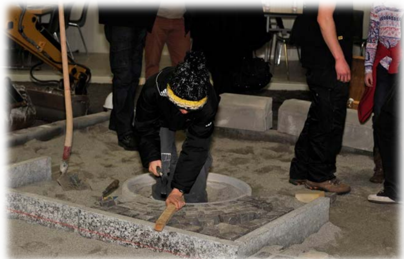
Et voilà, la relève est déjà prise !