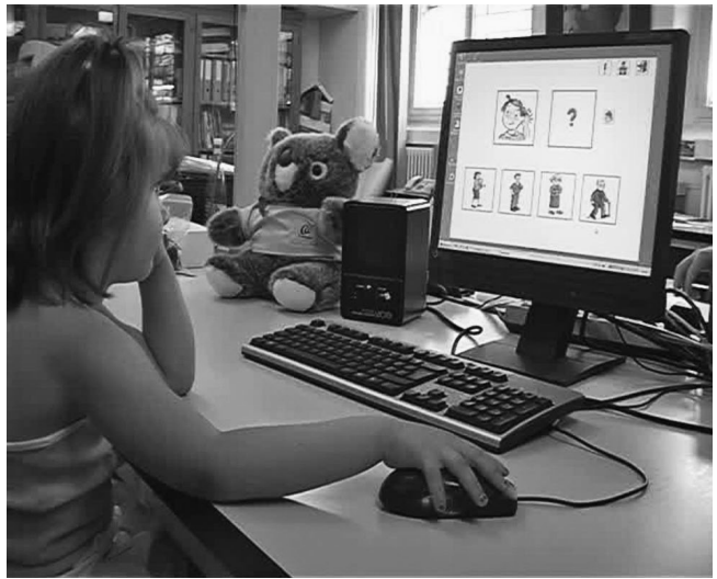
Figure 3 : enfant bénéficiant d'un implant cochléaire utilisant le logiciel de rééducation logopédique.

Au niveau des dispositifs d'interaction, l'ordinateur personnel a peu évolué depuis les années 1980 : interface graphique associée à des menus, entrée d'information par le clavier, sélection et manipulation par la souris. Ce n'est que récemment que les interfaces tactiles ont émergé, pour devenir aujourd'hui la norme sur les dispositifs mobiles personnels. A la différence des premiers écrans tactiles, l'interaction tactile multitouch 9 des tablettes et Smartphones n'est pas une simple transposition de l'interaction avec la souris ou avec un stylet, elle